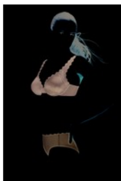
Dim : beauty-lift