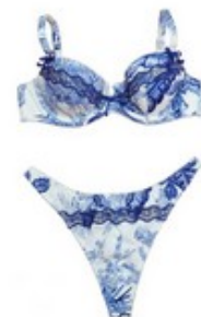
Charlott'Lingerie : Aquarelle

Romantique, extravagante, la collection Dolce Vita utilise des couleurs tendres avec des nœuds, des rubans, des dentelles, des libertys au charme parfois désuet. Aquarelle est un de ces modèles avec un imprimé bleu pastel et bleu nuit. www.charlott.fr